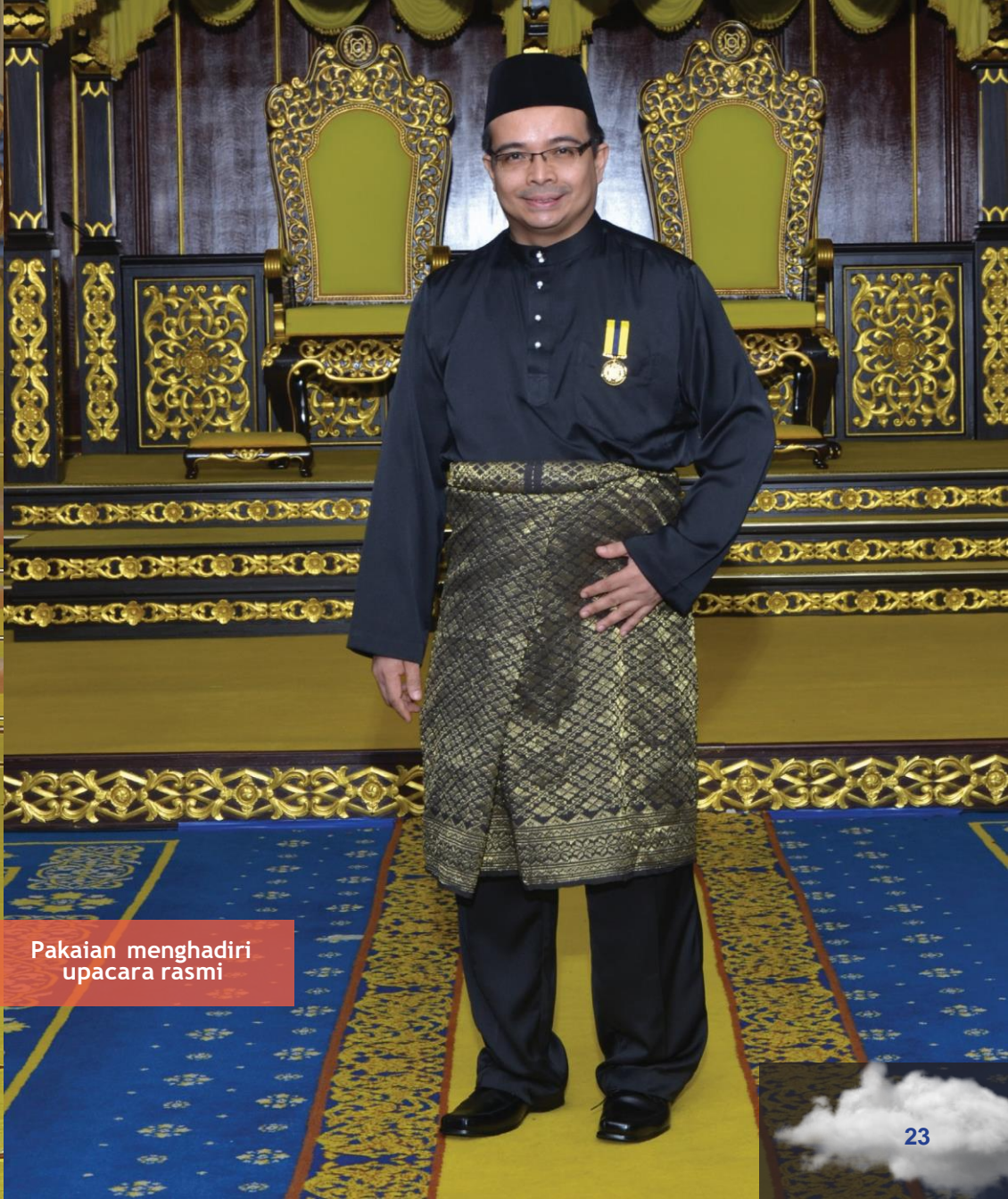
Pakaian menghadiri upacara rasmi