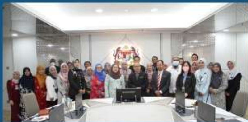
Kementerian Dalam Negeri 14 Februari 2023