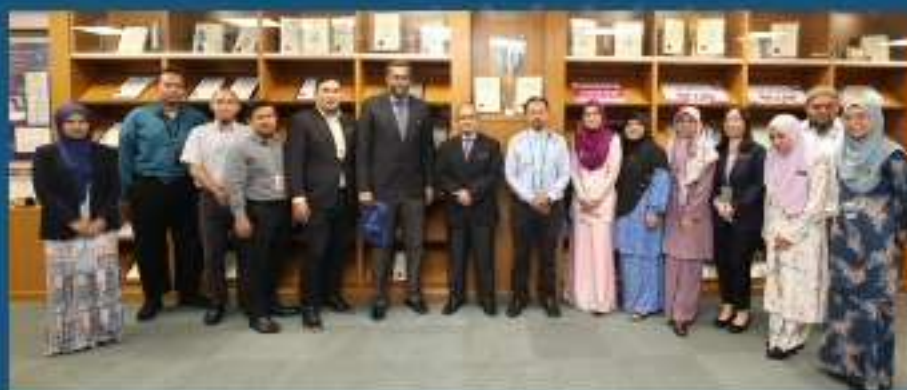
Pejabat Setiausaha Kerajaan Negeri Selangor 22 Mac 2023