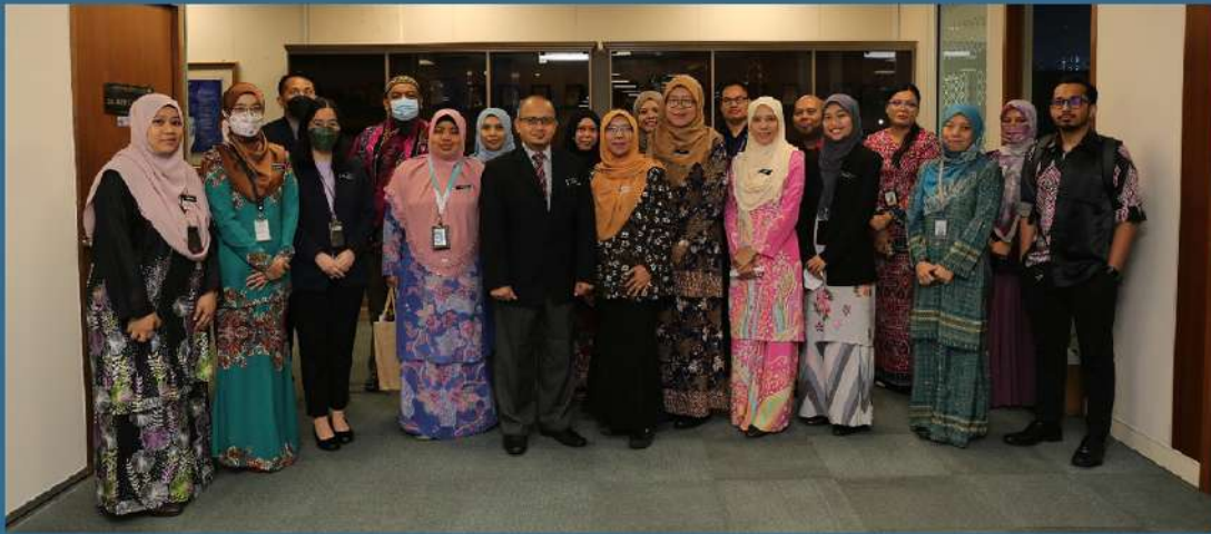
Kementerian Pengangkutan Malaysia 13 April 2023