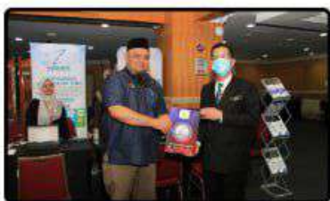
"ICT OPEN DAY" Kementerian Sumber Manusia 31 Oktober 2023

Satu pameran HRMIS telah diadakan Sempena Hari "ICT OPEN DAY" anjuran Kementerian Sumber Manusia pada 31 Oktober 2023.